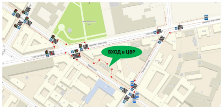
СХЕМА ОРГАНИЗАЦИИ ДОРОЖНОГО ДВИЖЕНИЯ ОТДЕЛЕНИЯ НА УЛ. ХЕРСОНСКОЙ 2

--- Маршруты движения пешеходов от и к Центру